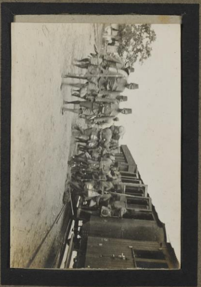
La compagnie d'infanterie de Ollschville pour Kassongo le 25 de 18-4-1918