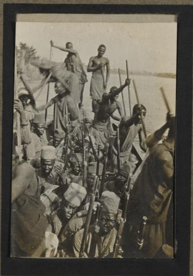
La compagnie traverse le fleuve Longo à Kassongo 21-5-1918