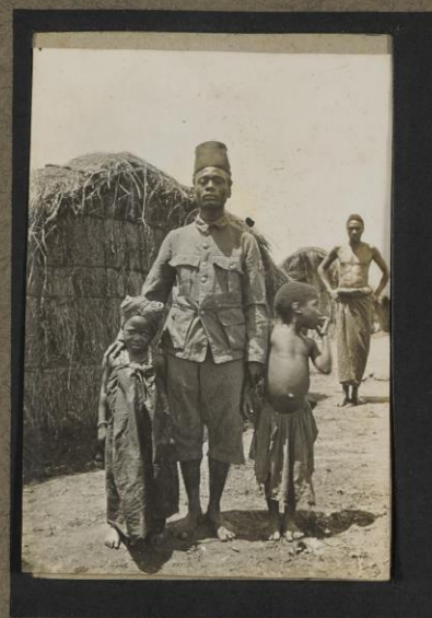
Mon planton et deux gosses Malagarasi.